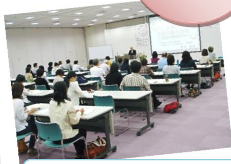
ひきこもりと発達障害学習会